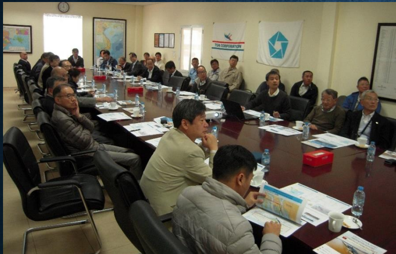
各JV代表より工事進捗状況の説明