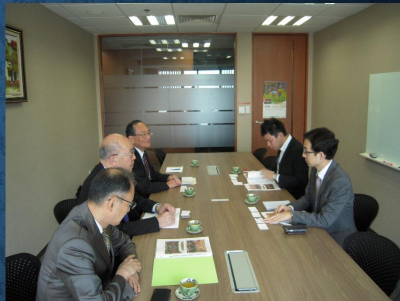
JICAベトナムオフィス訪問