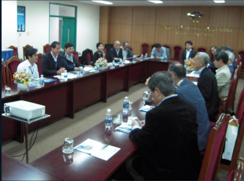
ダナン港会社から参加団員14名へ現況等説明