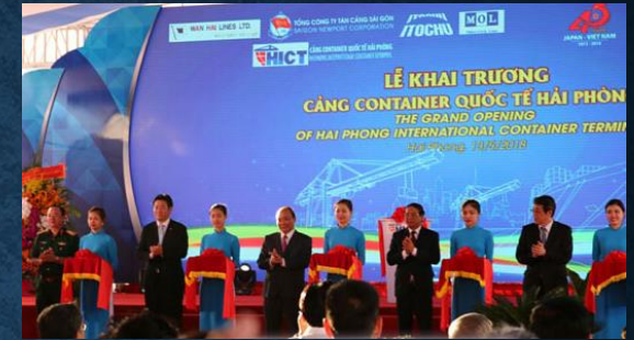
本年5月13日にコンテナターミナル(HICT)の開業式典