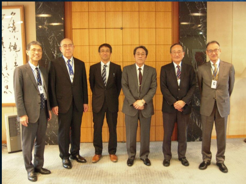
在ベトナム日本大使館訪問