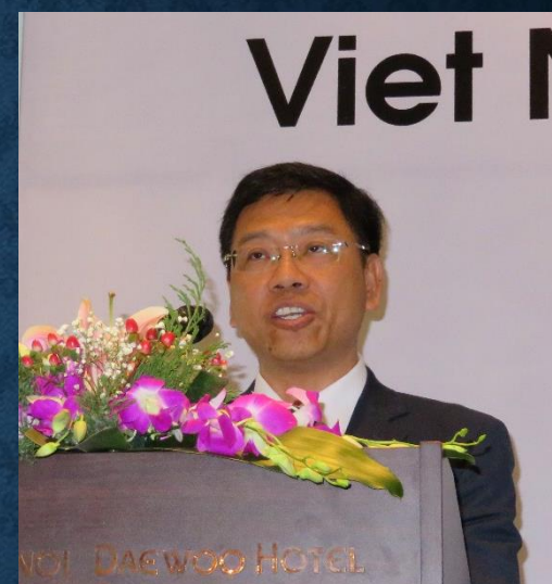
歓迎挨拶: VINAMARINE Sang 総裁