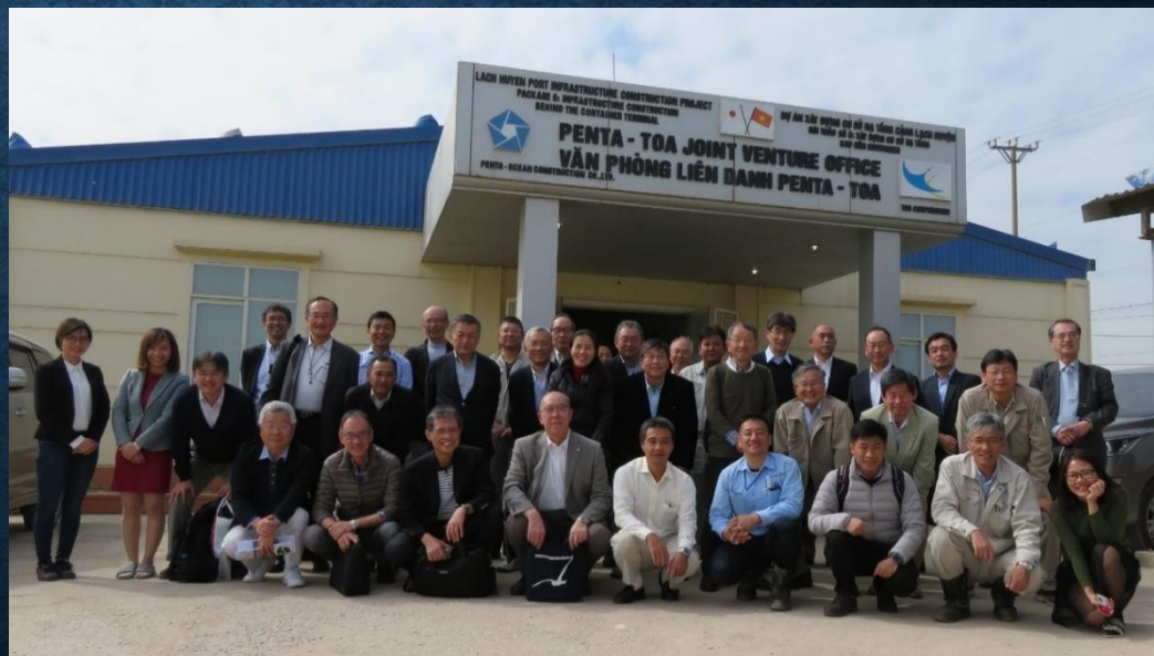
JV工事関係者の皆様と見学会参加団員27名