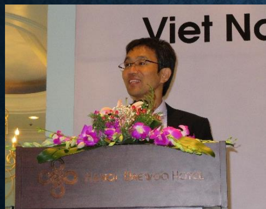
来賓挨拶: 日本大使館 林書記官