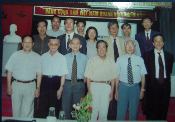
15年前のJOPCA 支援事業 港湾技術基準セミナーにて