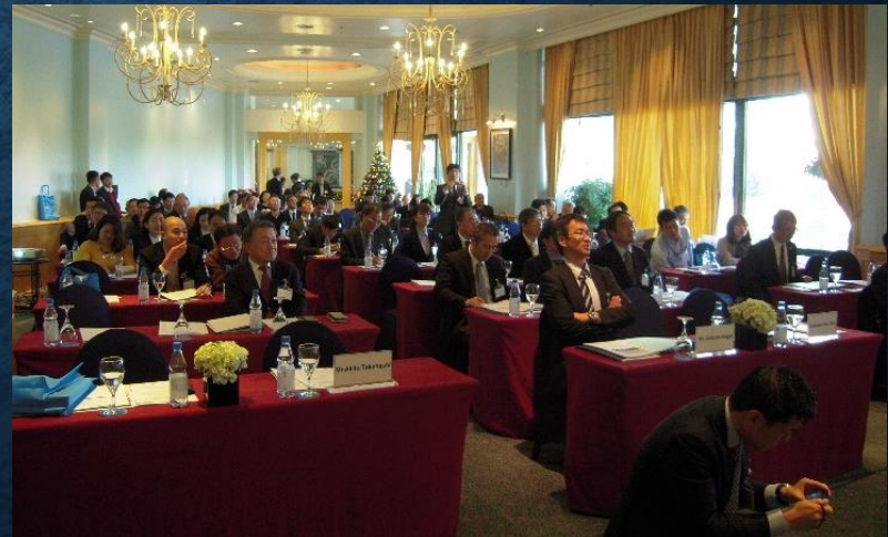
満席のセミナー会場