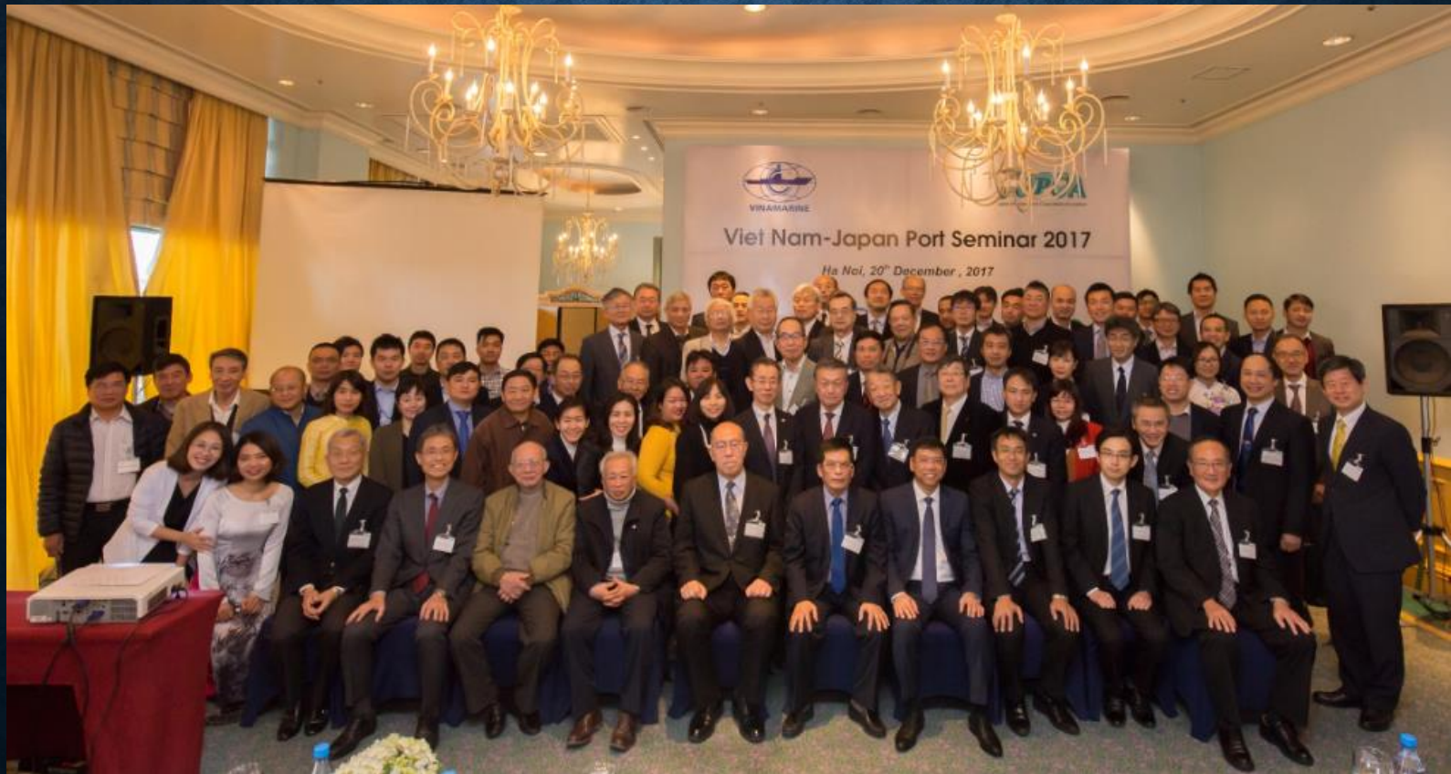
書籍贈呈式後のセミナー参加者集合写真