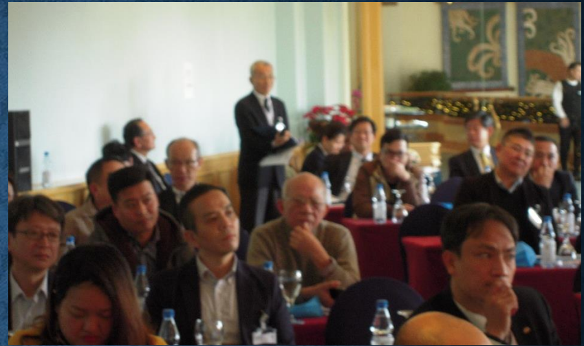
藤田企画委員から質問(第2部)