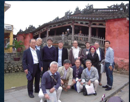
18世紀前半のダナン港開港まで 栄えた港町ホイアの日本橋にて