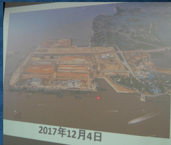
ドローン撮影によるCTの状況

お世話になった 五洋建設 東亜建設工業 東洋建設 りんかい日産建設 三井住友建設 の皆様、ありがとう ございました