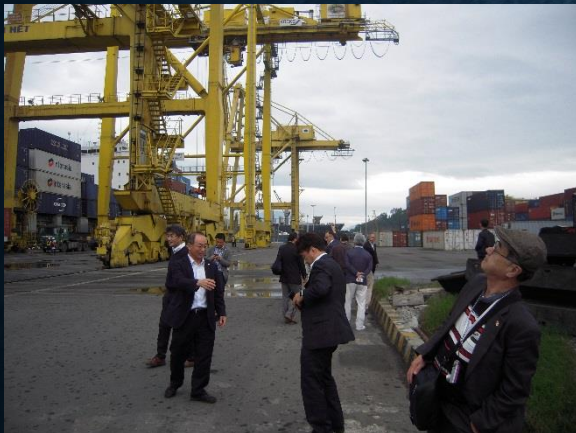
ティエンサ港区コンテナターミナル

アポ取りから 現地案内まで 全面のご支援 をいただいた JPCの皆様、 ありがとうございました