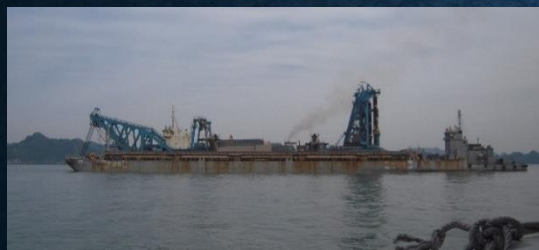
沖合10km超での航路浚渫工事

お世話になった 五洋建設 東亜建設工業 東洋建設 りんかい日産建設 三井住友建設 の皆様、ありがとう ございました