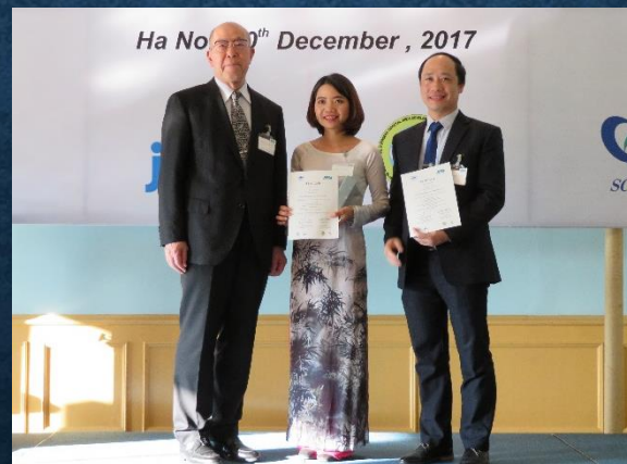
池田会長とHa 国際部長 から修了証授与