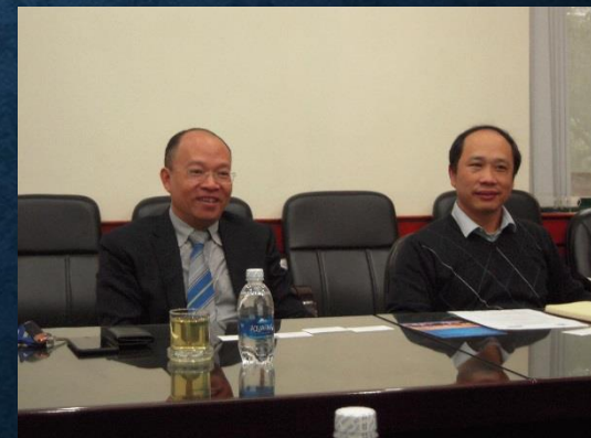
Thu 副総裁とHa 国際協力部長