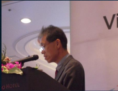
趣旨説明: JOPCA 大津企画委員