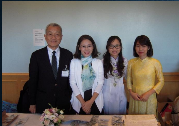
5年前と同じ二人が アオザイ姿で受付支援