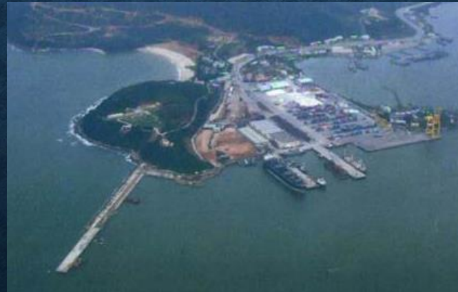
ティエンサ港区全景(第1期完成時)