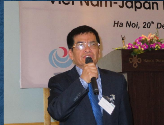
「ベトナムの港湾の管理運営」 Hue VAPO会長