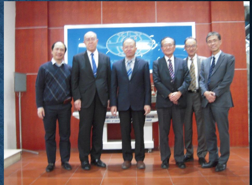
VAPO(ベトナム港湾/水路/海洋エンジニアリング協会)訪問